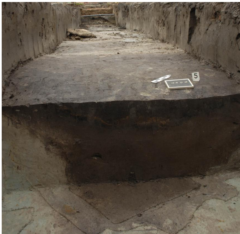
Foto: sleuf met kuilstructuur